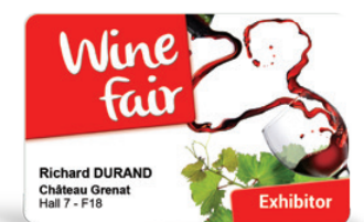
Einladungen zu Ihren Events